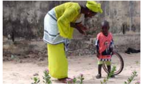
In Kinshasa helpt Brussel met de organisatie van de gemeentelijke administratie