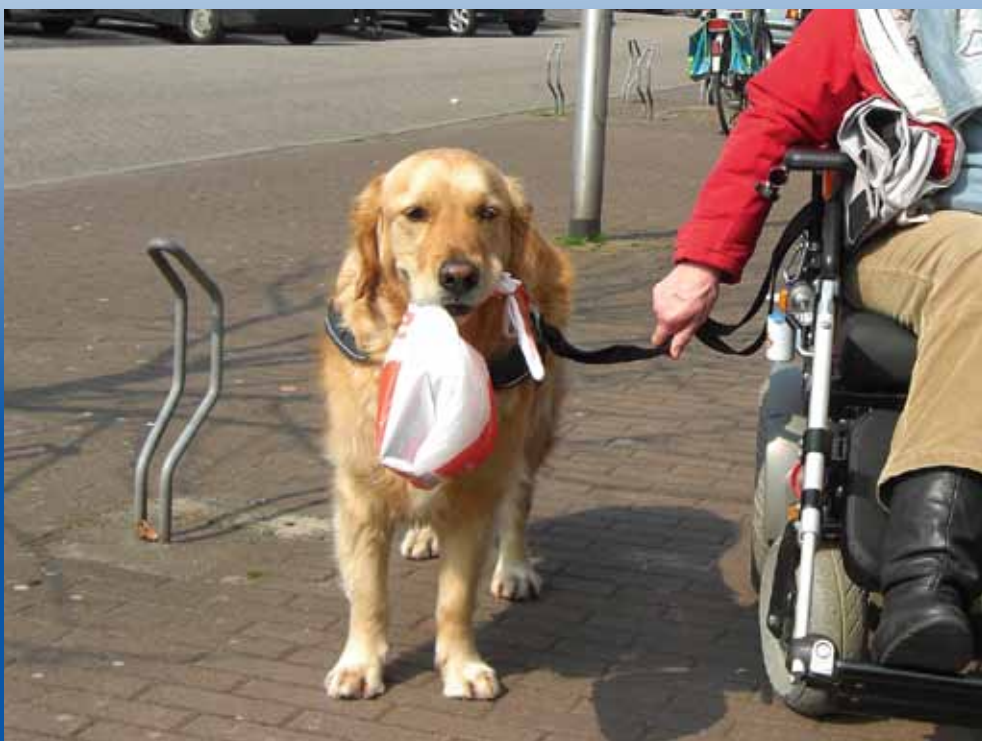
Blindengeleidehonden niet welkom in Brusselse Taxi's. |

weg niet vinden en wier rijvaardigheid dikwijls niet erg betrouwbaar is. Onlangs ontstond zelfs opschudding omdat sommige chauffeurs met een moslimachtergrond weigeren blindengeleidehonden - onreine dieren in hun ogen - aan boord te nemen. Alweer een mooi visitekaartje voor de hoofdstad van Europa.