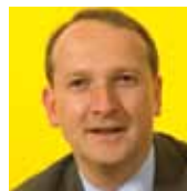
Bart Laeremans Senator

In plaats van altijd maar te plooiën en te knikken, moeten de Vlamingen in het dossier BHV de macht van het getal gebruiken. En ze moeten daarbij de Vlaamse onafhankelijkheid minstens gebruiken als stok achter de deur. Enkel met deze tactiek kan men indruk maken op de Franstalige partijen. Het enige wat nodig is, dat is een kleine dosis Vlaamse politieke moed.